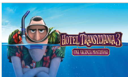
HOTEL TRANSYLVANIA 3- FLIXBUS

Per avere una panoramica completa dei nostri lavori visita il seguente link: www.wepromo.it