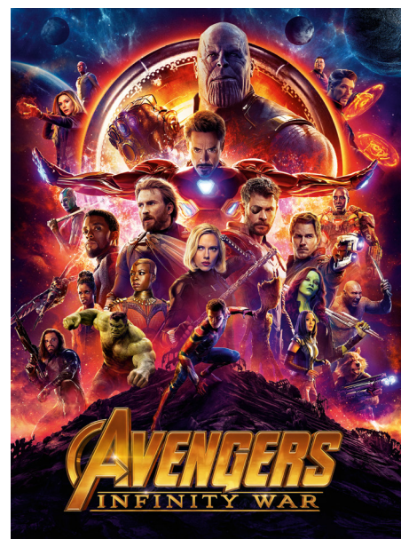
AVENGERS INFINITY WAR - UCI CINEMAS