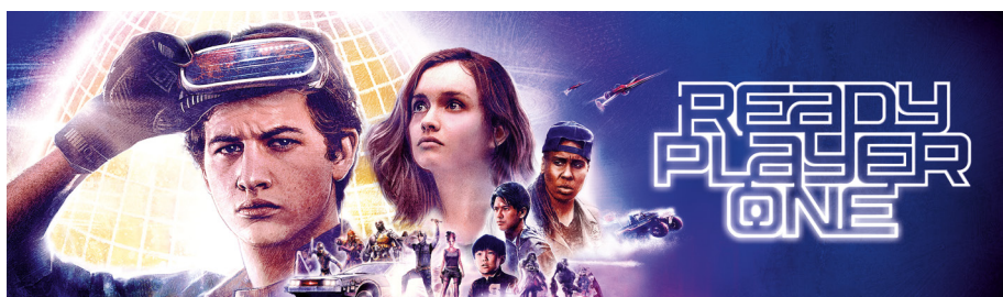
READY PLAYER ONE - PARKING GO