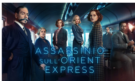
ASSASSINIO SULL'ORIENT EXPRESS - EURONICS